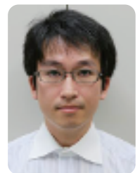
総務省自治行政局 マイナポイント施策推進室 課長補佐