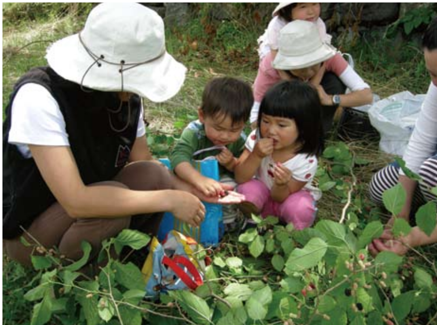
桑の実イベントの様子。 ちびっ子たちも初めて見る桑の実に興味津々

た。私は事務局になったとはいえ組織をまとめる知識も経験も無く、個々の事情を考えていると、どの人に何をどう頼んだらよいのか、さっぱり分からなかったのです。しかも活動内容は試行錯誤で、道具も資金も人脈も無く、組織が崩壊する前に、自分の体が崩壊してしまいました。 でも、この苦い経験がセンターの方向性を決めて行くことになったのです。