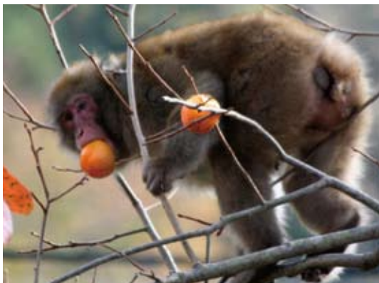
エサを求めてサルが来る