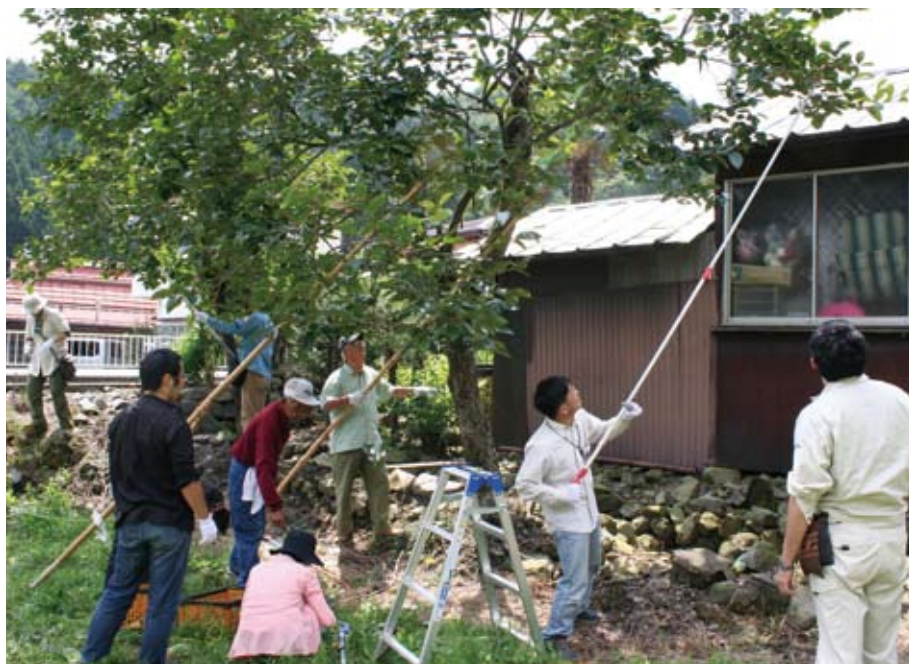
柿渋イベントの様子

けて行って体を動かし、自然の恵みを頂くと、「食べてばっかりじゃん!!」という企画をしています。でも、しっかり成果に結び付く、何ともおいしい活動なのです。