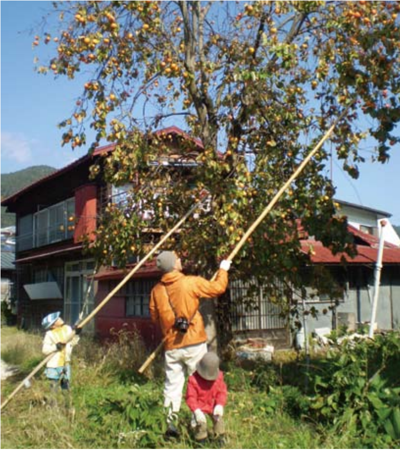
放置された柿は「柿採り隊」が持ち主に代わって収穫

ります。また、〇〇名人を紹介してくださったりして、すぐ隣でこんな面白いことをやっていたんだ、というような発見もたくさんあります。やや学術的に偏る場合もありますが、必ず体感して楽しいとか、知的好奇心をくすぐるようなイベントになるように工夫をしています。