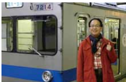
飯坂温泉に向かう電車の前で

4月14日、私はシンポジウム会場の打合せ等のため、初めて福島県の飯坂温泉を訪れました。何もできないのに安易に被災地を訪れることに後ろめたさを感じていましたが、現地では県外からの観光客が激減するなど今も震災や原発事故の影響が深刻だそうです。あれこれと頭のなかで考えているより、自分の目で見て自分の耳で聴いて実感するた