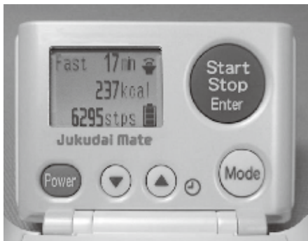
図1：坂道、階段でも正確にエネルギー消費量が測定できる携帯型カロリー計（熟大メイト）