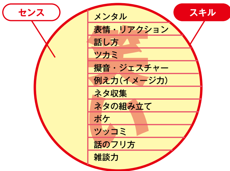
図2 笑伝塾スキル分布表